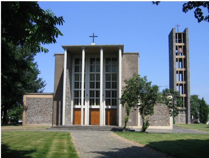
Foto: Michaëlkerk in het Eikske

De Michaelkerk en de Barbarakerk zijn twee leegstaande kerken. Hoewel de zorg voor deze kerken een primaire taak van het bisdom is, kan de overheid hierin een faciliterende en stimulerende rol vervullen. De plannen met betrekking tot de Michaelkerk zijn in een vergevorderd stadium. De herbestemming van de Barbarakerk is nog ongewis. Het Nieuw Apostolisch Kerkgenootschap (NAK) wil haar vier vestigingen die elders in de Parkstad zijn gelegen, in de Barbarakerk gaan onderbrengen. Zij moet de andere gebouwen nog verkopen alvorens er eigen geld beschikbaar komt voor de verwerving van de Barbarakerk. Het NAK denkt aan een multifunctionele invulling van het gebouw, maar heeft vooralsnog geen toekomstbestendig exploitatiemodel aangeleverd. Ook de herbestemming van de Theresiakerk in Lauradorp verdient aandacht. Een bijdrage van de provincie biedt wellicht, in samenwerking met IBA Parkstad, mogelijkheden.