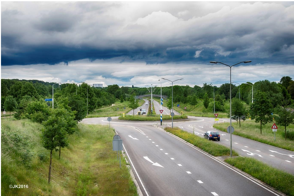
Foto: De aanleg van de Binnenring leverde een belangrijke bijdrage aan de verbetering van de leefbaarheid in veel buurten.

Vooralsnog staat de gemeente voor een investering van 3,5 miljoen euro aan de lat en de Provincie ook. Daarmee zullen niet alle kosten gedekt zijn. Een extra investering van de Provincie Limburg van 5 miljoen euro vanuit de investeringsagenda zou wenselijk zijn.