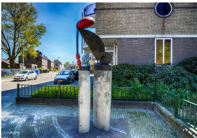
Foto: Identiteit-bepalende kunst in de buurt: D'r Sjewëgelsöpper in Nieuwenhagen

Kunst draagt bij aan het gevoel van identiteit en kan bovendien een goede middel zijn om verloederde plekken in buurten en wijken tegen te gaan. In het kader van het project 'Kunst op straat' laten we de bevolking meebepalen op welke wijze de identiteit van hun buurt met aansprekende kunstvormen zichtbaar wordt gemaakt. StreetArt is een voorbeeld van kunst waaraan gedacht wordt, waarbij de organisatie StreetArt Heerlen om ondersteuning en advies kan worden gevraagd. Ook andere kunstvormen worden nadrukkelijk niet uitgesloten.