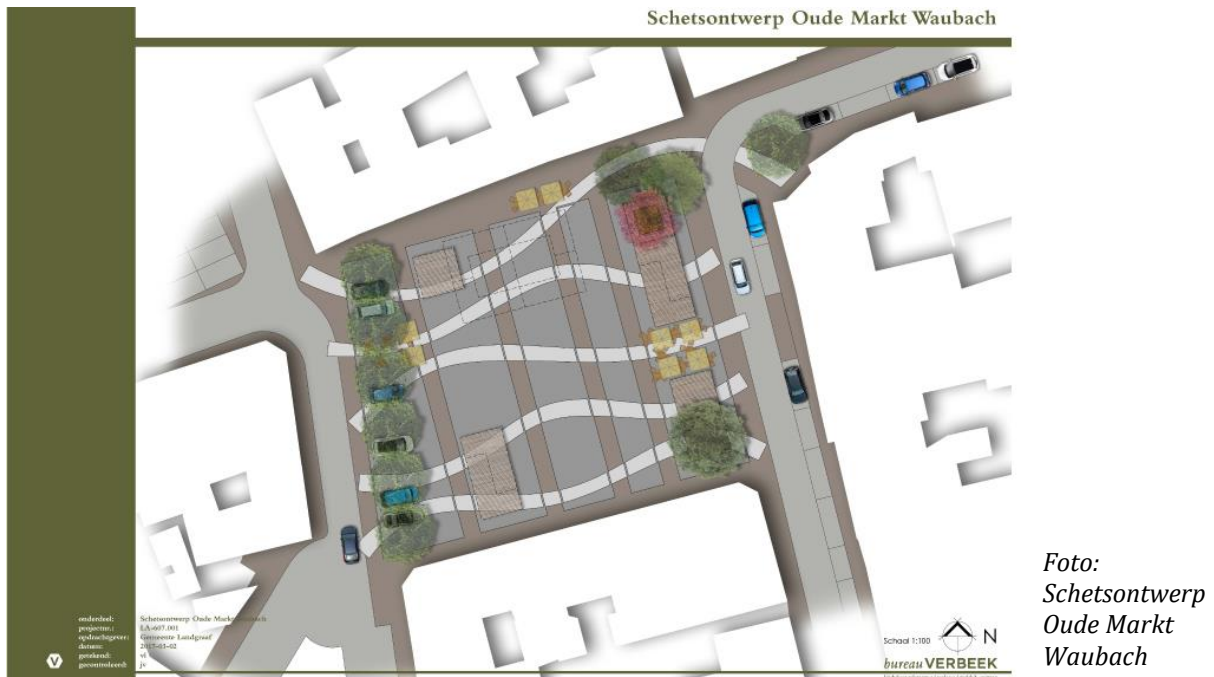
Foto: Schetsontwerp Oude Markt Waubach

Aan de Oude Markt in Waubach is een aantal oude panden goed bewaard gebleven. Toch komt de potentie van het oude markplein met zijn fraaie gevels nu nog onvoldoende uit de verf. Leegstand vormt een bedreiging voor de leefbaarheid. Er zijn kansen om van dit markplein een pittoresk en levendig dorpsplein te maken, door koppelingen te leggen tussen horecavoorzieningen, terrassen, vormen van dagbesteding en het naastgelegen Theater Landgraaf. De gemeente Landgraaf heeft in samenwerking met inwoners en Bureau Verbeek een plan ontwikkeld. De provincie kan gevraagd worden om aan de investeringen die hiervoor nodig zijn een bijdrage te leveren.