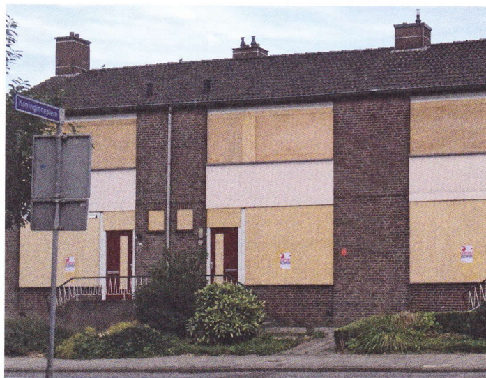
Sloop van goede huurwoningen Lichtenberg