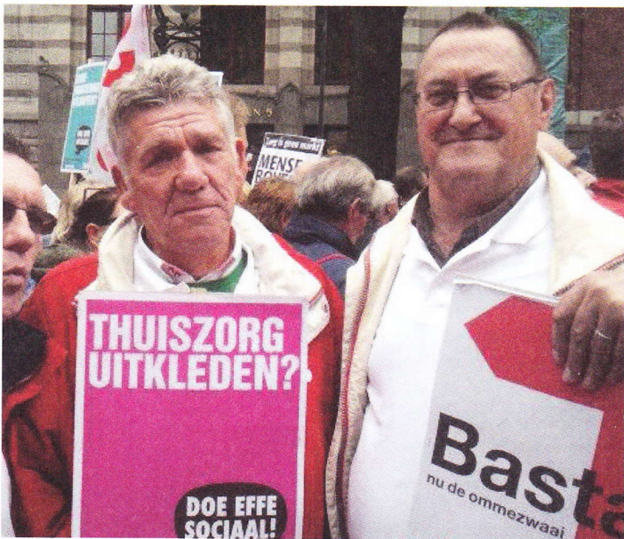
Ook in Landgraaf tijd voor de ommezwaai: Basta!

gebied van armoedebestrijding en sociaal beleid. De gemeente Heerlen is volgens het tijdschrift de beste gemeente voor mensen die van een minimum moeten rondkomen. De SP is onder