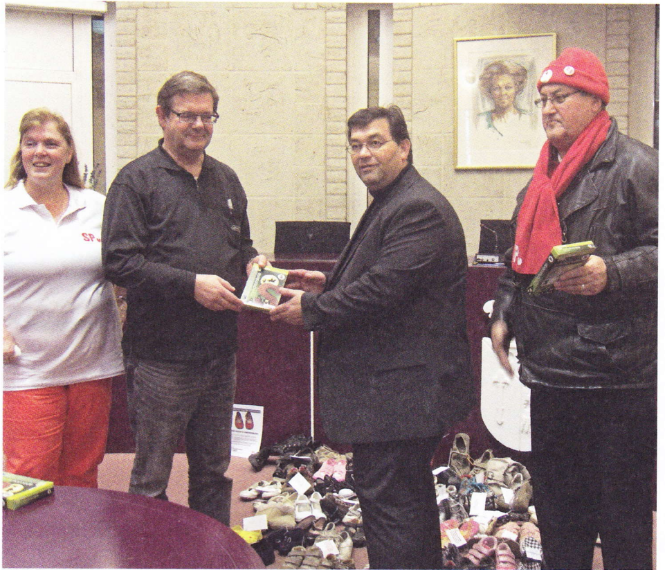
Schoentjesactie tegen kinderarmoede in Landgraaf.

› Kritiek op het gemeentebestuur is mooi, maar willen jullie ook zelf mee besturen? 'Absoluut. Wij willen en kunnen meedoen in een college. Wij willen Landgraaf beter en socialer maken en dat lukt het beste als je zelf aan de knoppen zit. Wat ons misschien wel onderscheidt van sommige andere partijen is dat wij niet bereid zijn mee te besturen tegen elke prijs: wij willen ten miste een stevig deel van ons programma uitgevoerd zien worden. Alleen meebesturen voor een mooie baan op het pluche is zinloos.'